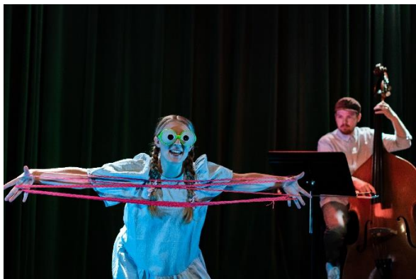
Frå «Hit eit steg», foto: Michaela Gettwert

Totalt publikum: 3222. Framsyninga vart spelt med strenge koronarestriksjonar.